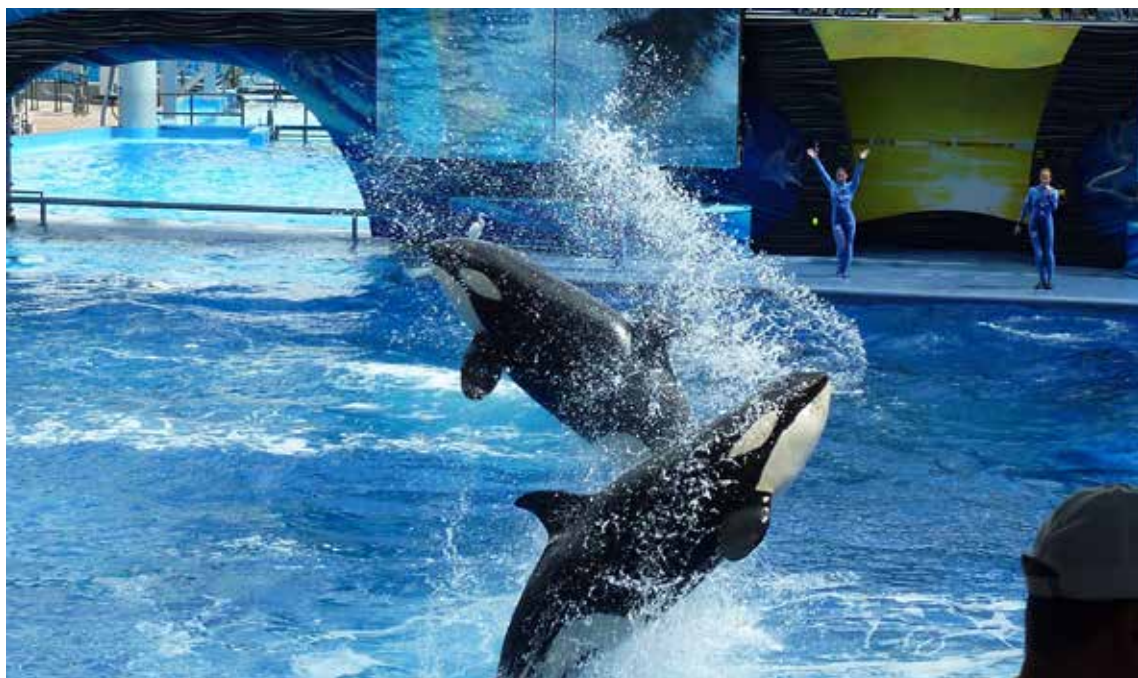
Vilde dyr skal opleves i naturen. De fleste rejsebureauer har for længst droppet underholdningsshow's med for eksempel spækhuggere.

Da brancheforeningen Danmarks Rejsebureau Forening (DRF) i slutningen af 2019 lagde strategi for det kommende år, var et af de vigtigste punkter på dagsordenen bæredygtig turisme og bæredygtige rejser. Via workshops, særlige bæredygtighedsprogrammer og andre tiltag skulle DRF i 2020 gå målrettet efter at få så mange medlemsbureauer som muligt til at arbejde med bæredygtighed på den ene eller den anden måde. Udgangspunktet var, at bureauerne kunne begynde hjemme i de fysiske omgivelser på bureauet ved for eksempel at udskifte gamle elpærer med nye sparepærer, eller de kunne begynde ude på deres destinationer med at undersøge for eksempel hotellernes affaldshåndtering, eller hvordan turismen det pågældende sted stillede sig i forhold til beskyttelse af vilde dyr. Der var – og er – emner nok at tage fat på, og det ene var for så vidt ikke vigtigere end det andet. Det vigtigste var at komme i gang – men så kom coronakrisen, som i løbet af ganske kort tid udviklede sig til en pandemi. Pandemien lagde rejsebranchen fuldstændig ned, og den bevirkede, at branchen, der stadig er underdrejet, naturligt nok rettede fokus mod ren og skær overlevelse.