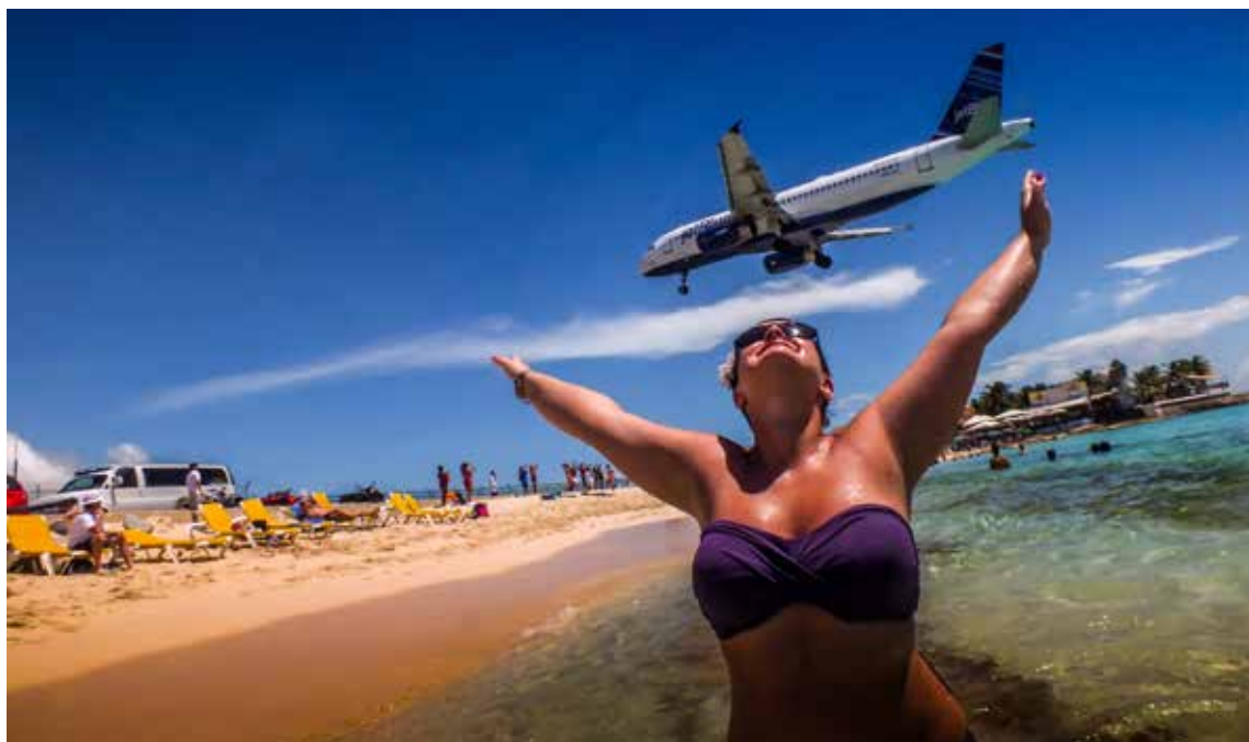
Flytrafik er ikke godt for klimaet, og DRF tror på, at kunder i nær fremtid vil kræve en langt mere bæredygtig flytrafik.

særligt nedsat CSR-Advisory Board. Hjemmesiden, der kun er for medlemmer, indeholder værktøjer og inspiration til at arbejde mere bæredygtigt. DRF har også repræsenteret danske og europæiske rejsebureauer i EU's Tourism & Sustainability Group fra 2004, og frem til at arbejdsgruppen blev nedlagt i 2013. Når DRF i dag alligevel ikke har flere medlemmer under den bæredygtige fane, er det dog ikke kun pandemien, der ligger til grund. Stopklodsen for mange, både bureauer og gæster, er blandt andet, når man præsenteres for prisen på det bæredygtige alternativ. Der er stadig mange, også dem, der ellers nok har råd, som hellere køber hos nabo-rejsebureauet, hvis de kan spare 1000 kroner. For nogle bureauer virker det også helt uoverskueligt, at skulle i gang med en større omorganisering af leverandører og så videre.